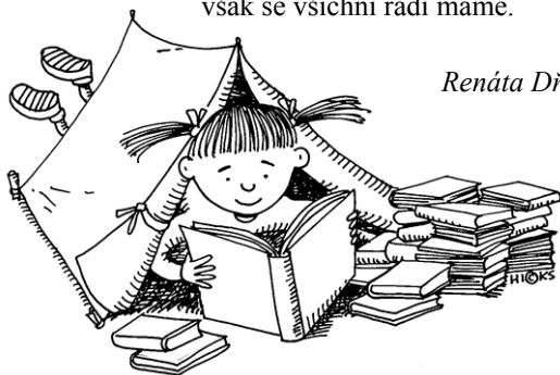
Renáta Dřimalová, 7. tř.

Ve stanu je vždycky sranda, bude nás tam celá banda. Společně si zazpíváme, však se všichni rádi máme.