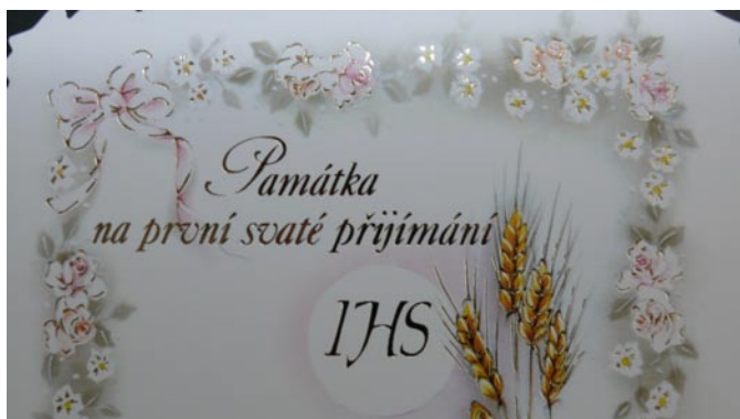
24.května 2009 v kostele sv. Jiří a Martina v Kobylí